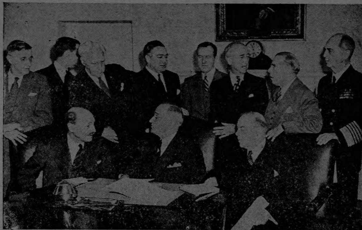
Sentados, de izquierda a derecha: Clement Attlee, Primer Ministro inglés; el Presidente Truman; y Mackenzie King, Primer Ministro del Canadá.

WASHINGTON. — La reciente declaración del Presidente Truman y de los primeros ministros de Inglaterra y el Canadá, sobre la bomba atómica, hace ver claramente que "la única protección posible para el mundo civilizado contra el empleo de los últimos adelantos de la ciencia para fines destructivos es evitar la guerra." Erradicar para siempre el azote de la guerra en este mundo y mantener el predominio de la ley entre naciones, es una cosa que no podrá realizarse "sin contar con el apoyo más completo" del nuevo Organismo de las Naciones Unidas, dijeron los mencionados estadistas. Así pues, al confiar el problema de la bomba atómica al Organismo de las Naciones Unidas, dan amplia prueba de su fe en la capacidad de esta coalición de pueblos amantes de la paz para hallar "salvaguardias efectivas" contra el empleo destructivo de los átomos. Es evidente para todos que la más efectiva garantía es la de un mundo organizado para el mantenimiento de la paz.