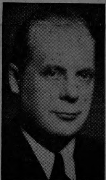
Karl E. Mundt Miembro de la Cámara de Representantes

WASHINGTON. — El Congreso de los Estados Unidos estudia la legislación introducida por el Representante Karl E. Mundt, del Estado de Dakota del Sur, que contribuiría a promover aún más las relaciones amistosas entre las repúblicas americanas proveyendo cuatro becas interamericanas. El proyecto de ley auspiciado por el Representante Mundt provee que 1,000 estudiantes de las escuelas normales estadounidenses sean seleccionados para residir durante un año y estudiar en escuelas similares en los paí-